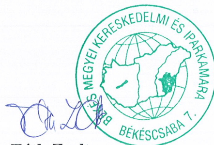
Tóth Zsolt titkár